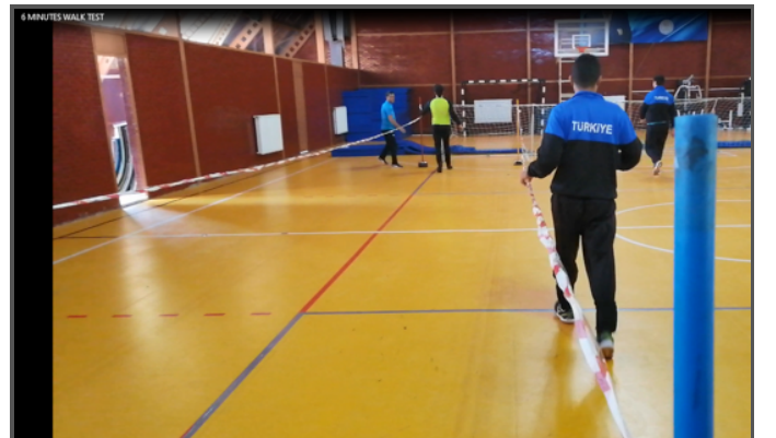
Şekil 2. Görme kaybı olan sporcuların 6 dakika yürüme testi koridorunu tanıması için uygulanan deneme görüntüsü

Aerobik uygunluğun değerlendirilmesi: Görme kaybı olan sporcuların aerobik uygunlukları submaksimal bir test olan altı dakika yürüme testi (6-DYT) ile değerlendirildi (18). Bu test teknik gereksinimleri düşük, kolay uygulanabilen ve güvenilirliği yüksek bir testtir. Sporcunun 6 dakika boyunca kat ettiği toplam mesafe (TM) metre cinsinden kaydedilir. Sporcu kapalı bir mekânda aralarında 15 m mesafe olan, yerden en az 1 metre yüksekliğinde halat gerili olan iki uzun koni ile belirlenen bir koridorda (toplam 30 m) 6 dk süre ile gidiş dönüşlü olarak mümkün olan en yüksek TM'yi kat edecek şekilde yürütülür (Şekil 2).